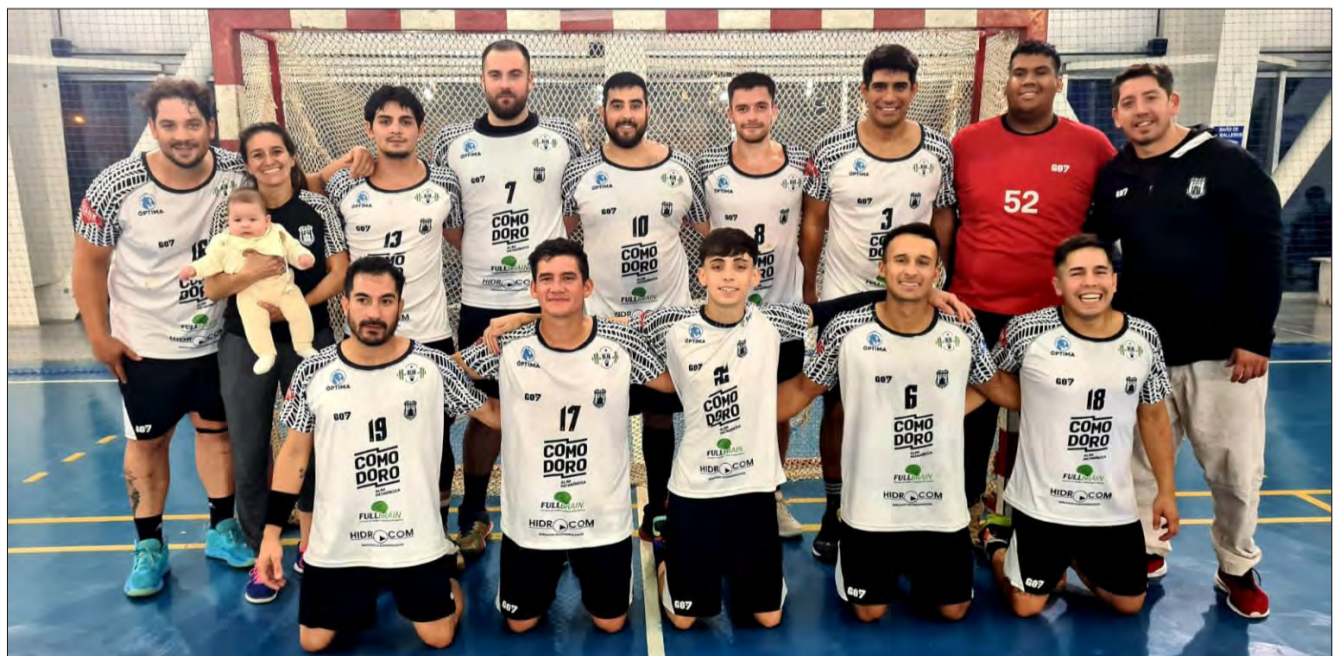
• El campeonato se iniciará este lunes.

El certamen, es organizado por la Federación Chubutense de Balonmano junto a la Asociación Comodorense de Balonmano y Comodoro Deportes con el aval de la Confederación Argentina de Handball. La presentación del torneo Nacional B de clubes está programada para hoy a las 19.00 en el Hotel Deportivo de la ciudad en km 3.