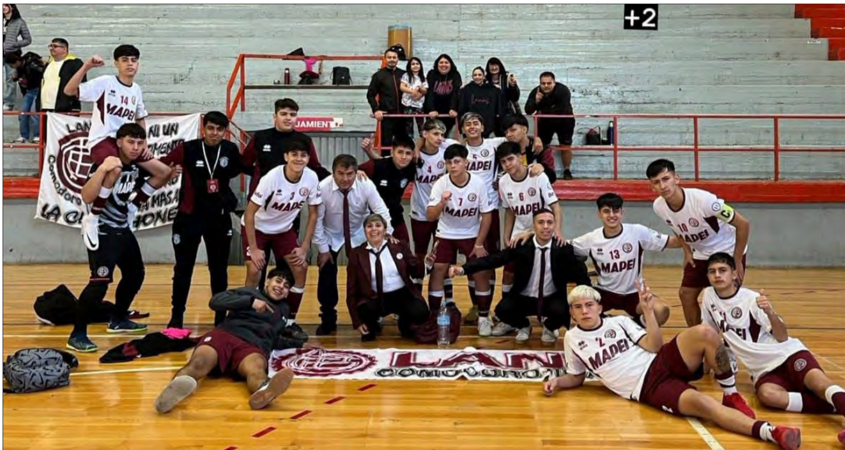
• Lanús ganó tres partidos en dos días y fue el primer clasificado.

Finalmente, Luz y Fuerza, que hizo 20 goles en las dos primeras jornadas, anoche buscaba el tercer éxito en fila al medirse con Santa Pablo de Mendoza para quedar en lo más alto y ase-