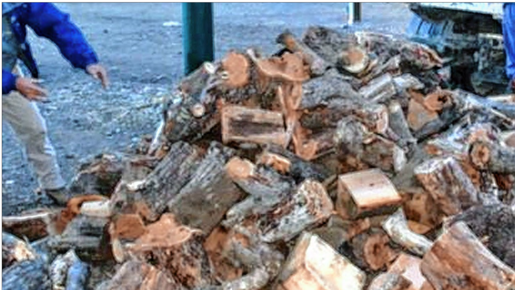
● Bajas temperaturas. En el marco del temporal de lluvia y nieve que afecta esta zona, desde el Municipio adelantaron la entrega de leña a las familias que utilizan ese material para calefaccionarse y concinar.

En esa línea, agregó que se está trabajando desde la Dirección de Ayuda Social Directa, en conjunto con Defensa Civil, vecinales y otras instituciones. “Debemos tener en cuenta que